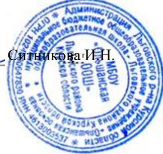
ГРАФИК ПРОВЕДЕНИЯ ВПР В 2024 ГОДУ В МБОУ «Ольшанская ООШ» Льговского района Курской области