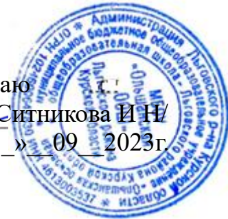
График проведения контрольных работ 2023-2024 учебный год